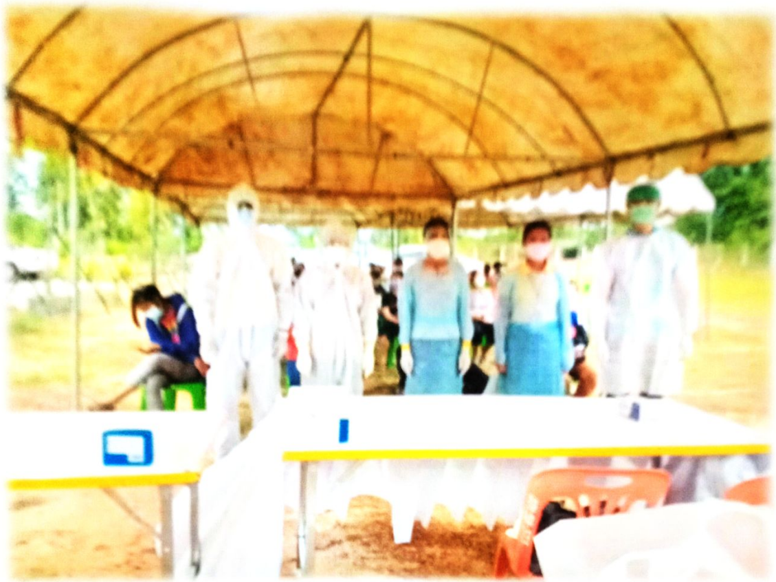
ได้รับความอนุเคราะห์จากเจ้าหน้าที่จาก รพ.สต.หนองแวง ในการตรวจคัดกรองหาเชื้อ