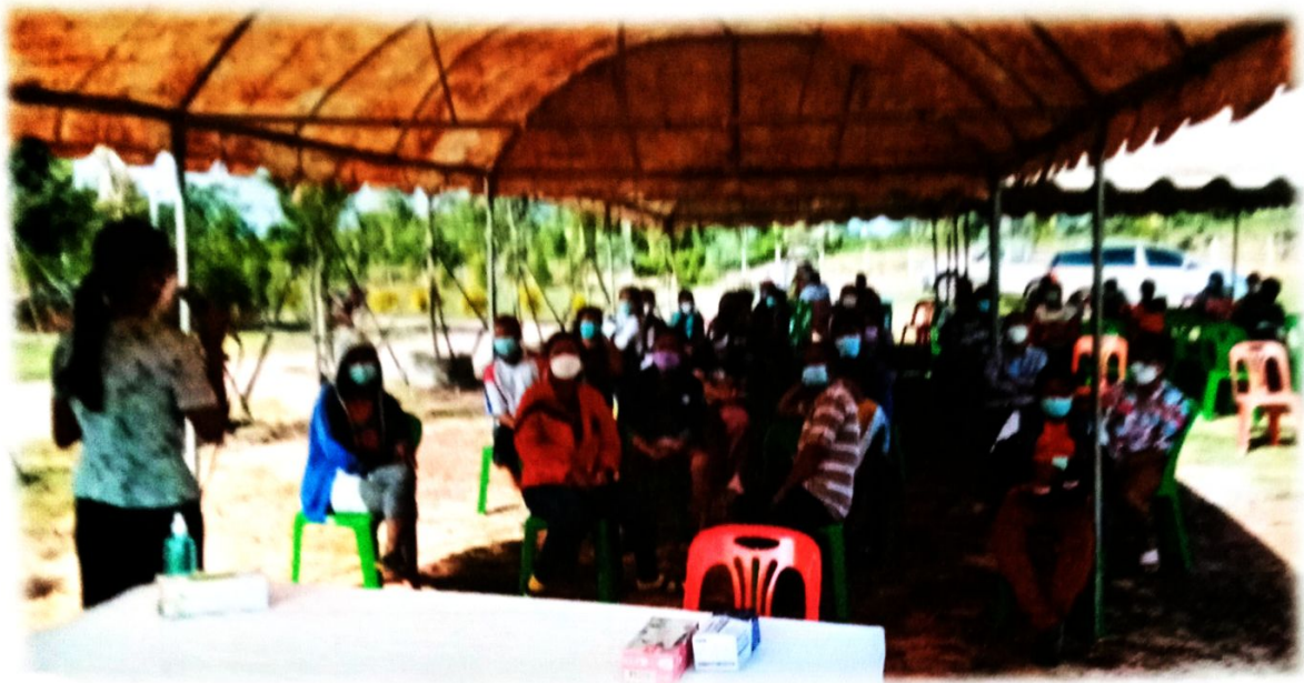
การแนะนำและทำความเข้าใจเบื้องต้นเกี่ยวกับการคัดกรองหาเชื้อโควิด ๒๐๑๙